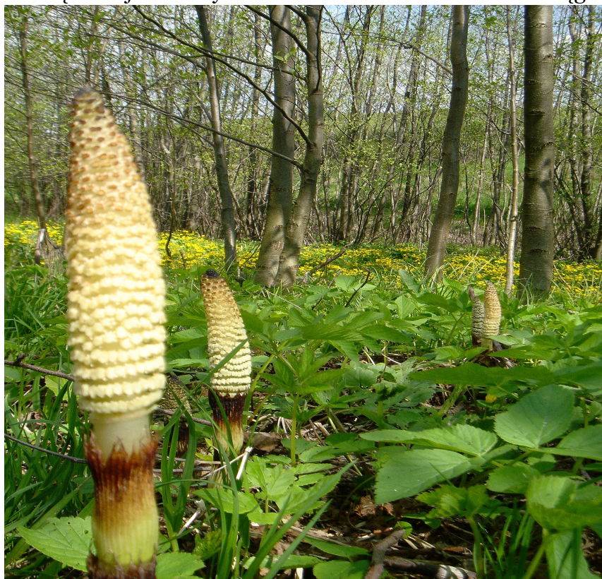
Rys.6 Wiosna we Wrocance.

Klimat jest charakterystyczny dla Pogórza Jasielskiego – przejściowy między nizinnym a górskim. Lokalne anomalie termobaryczne są ściśle związane z ukształtowaniem terenu i sąsiedztwem zbiorników wodnych. Średnia roczna temperatura dnia wynosi tu około +7°C, średnia temperatura dnia w ciągu lata kształtuje się na poziomie około +18° C, w ciągu zimy obniża się od -3° C do -5° C. Mróz występuje tu w ciągu 50 - 70 dni, przymrozki 100 - 130 dni. Średnia opadów wynosi ok. 700 -750 mm. Pokrywa śnieżna zalega 60 - 80 dni, a długość okresu wegetacyjnego 210 - 220 dni. W ciągu roku przeważają wiatry południowo zachodnie. Rejon ten posiada stosunkowo dużo dni pochmurnych i w związku z tym warunki nasłonecznienia są raczej niekorzystne. Średnie nasłonecznienie w ciągu dnia trwa 3,5