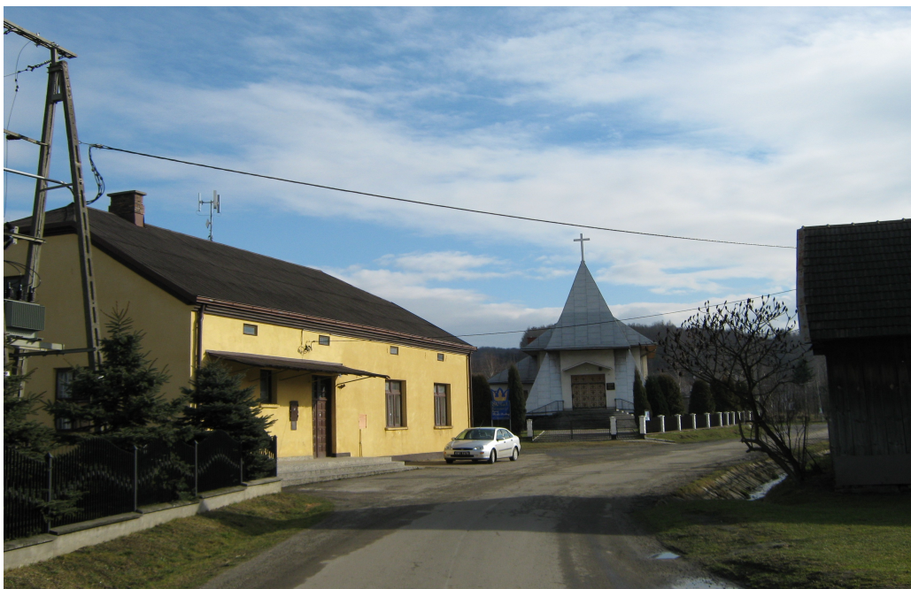
Rys. 2 Dom Ludowy i kościół parafialny.

Instytucje społeczno- kulturalne: Kościół Parafialny, Szkoła Podstawowa, Dom Ludowy.