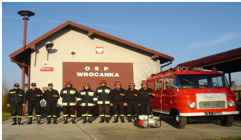
Rys.5 Ochotnicza Straż Pożarna we Wrocance

Obecnie istniejące na terenie wsi organizacje to: Ochotnicza Straż Pożarna, Koło Gospodyń Wiejskich.