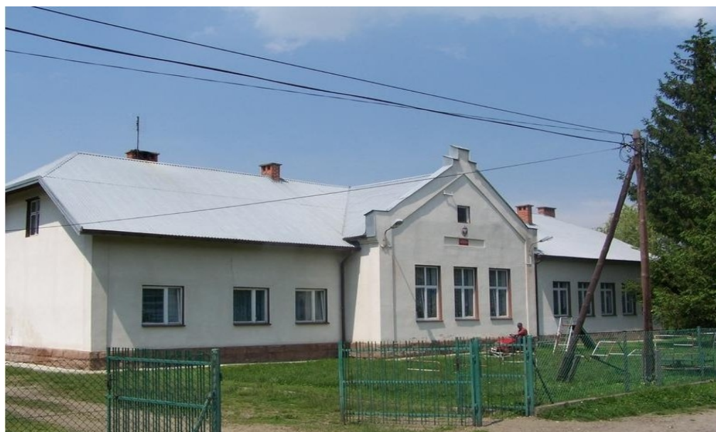
Rys.3 Szkoła Podstawowa