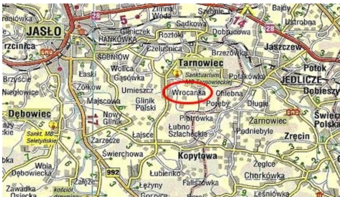
Rys.1. Mapa lokalizacyjna.

Sołectwo położone kilka km na południe od Tarnowca, w skład którego wchodzi przysiółki: Tobyłka, Ciszówka, Brzeziny, Baranica, Folwark, Nowa Wieś, Porąbki. Na szczególną uwagę zasługują trzy z wyżej wymienionych przysiółków: położony na wzgórzu przysiółek Brzeziny z najwyższym wzniesieniem w okolicy 303 m.n.p.m (nazwa miejscowa: Machowica), przysiółek Porąbki – stanowiący granicę Wrocanki również położony na wzniesieniu, przysiółek Budy – będący granicą z Potakówką – malownicza okolica z lasem, charakteryzująca się zróżnicowanym terenem.