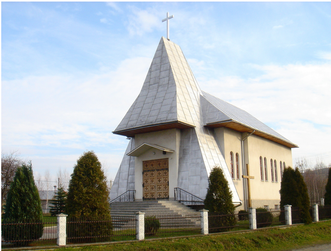
Rys.4 Kościół parafialny