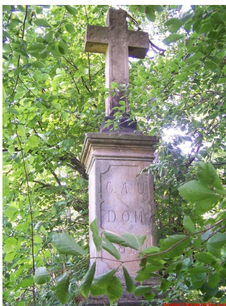
Rys. 7 Krzyż we Wrocance

1. Krzyż przy skrzyżowaniu dróg z Wrocanki do Potakówki i do Tarnowca, na obszarze dawnego folwarku. Krzyż kamienny na wysokim postumencie, ustawionym na trójstopniowej podstawie z płyt kamiennych. Postument w kształcie prostopadłościanu z bazą, zwieńczony gzymsem. W ścianie frontowej ozdobna prostokątna płyca o wklęsłych narożnikach, wryty w niej napis: „G.A.U.D.O.M