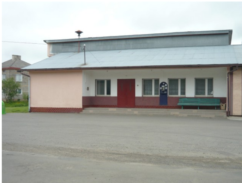
Fot.3 Dom Ludowy