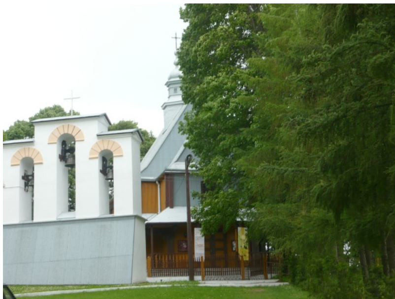
Fot.1 Kościół Parafialny

Instytucje społeczno- kulturalne: Kościół Parafialny, Szkoła Podstawowa, Dom Ludowy, Strażnica OSP, Koło Gospodyń Wiejskich, klub sportowy „Zorza 03”.