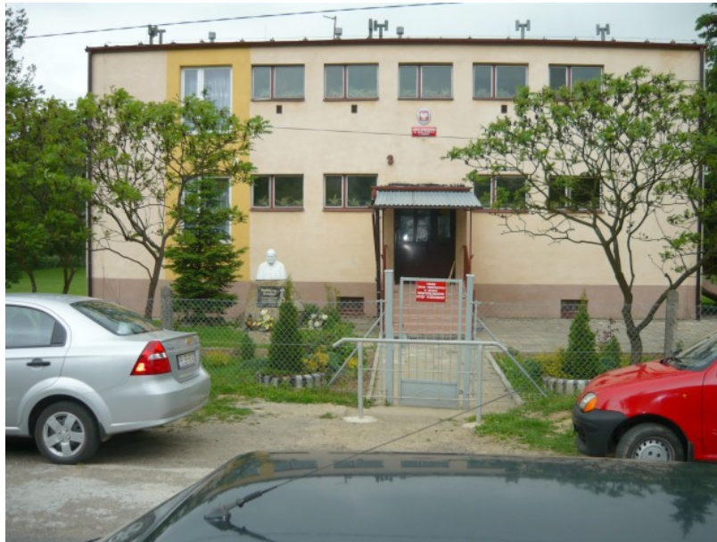
Fot.2 Szkoła Podstawowa