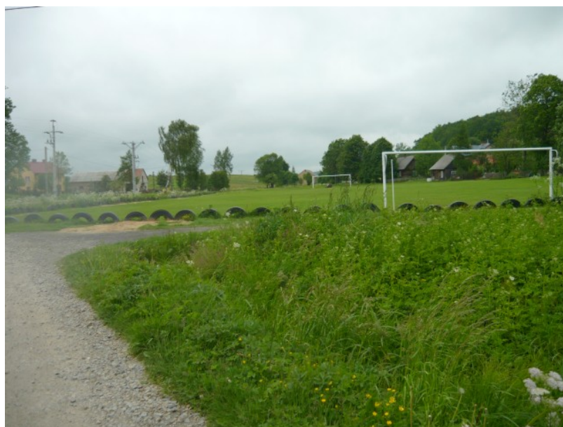
Fot.5 Boisko piłkarskie

Na terenie sołectwa znajduje się boisko sportowe na którym rozgrywają swe mecze juniorzy i seniorzy klubu sportowego „Zorza 03”. Tutaj głównie skupia się życie kulturalno-sportowe. Oprócz rozgrywek piłkarskich odbywają się również zawody sportowo-pożarnicze. Nie spełnia ono jednak wymogów na grę w wyższej klasie rozgrywkowej.