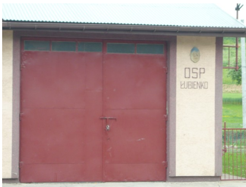
Fot.4 Strażnica OSP